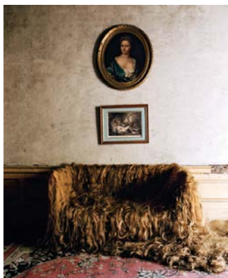
DELPHINE BALLEY Le Sofa , 2007 photo couleur sur papier, 120 x 102 cm