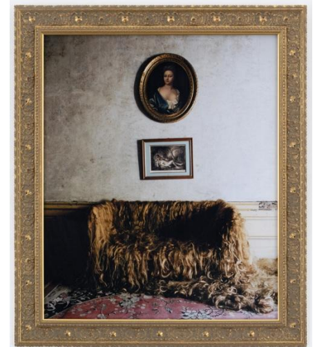
Delphine BALLEY, Le Sofa , 2007