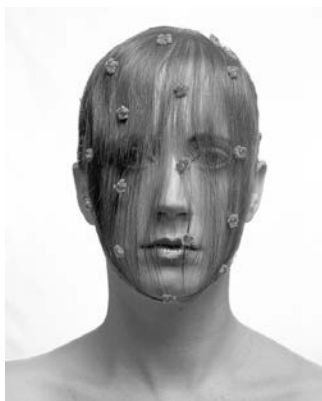
NATACHA LESUEUR Lorraine , 2007 impression sur papier Fine Art, contrecollée sur dibond, 154 x 124 x 5 cm. © ADAGP Paris 2012