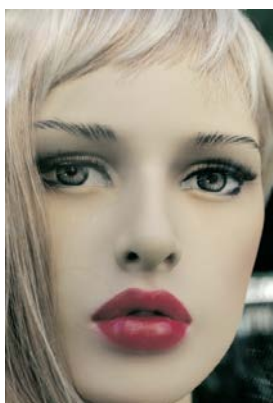
MARYLENE NEGRO Eux/Them , (détail de la série) 2001 impression jet d'encre sur bâche plastique 120 x 180 cm. © M. Negro