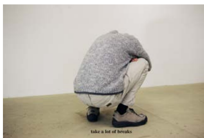
ERWIN WURM Instructions for Idleness , (détail de la série) 2001 tirage couleur, 43 x 65 cm. © ADAGP Paris 2012

« Tout ou partie des oeuvres figurant dans ce dossier de presse sont protégées par le droit d'auteur. Les oeuvres de l'ADAGP ( www.adagp.fr ) peuvent être publiées aux conditions suivantes : • Pour les publications de presse ayant conclu une convention avec l'ADAGP : se référer aux stipulations de celle-ci. • Pour les autres publications : - exonération des deux premières reproductions illustrant un article consacré à un événement d'actualité et d'un format maximum d' 1/4 de page; - au-delà de ce nombre ou de ce format les reproductions seront soumises à des droits de reproduction/représentation; - toute reproduction en couverture ou à la une devra faire l'objet d'une demande d'autorisation auprès du Service Presse de l'ADAGP ; - le copyright à mentionner auprès de toute reproduction sera : nom de l'auteur, titre et date de l'oeuvre suivie de © Adagp, Paris 201.. (date de publication), et ce, quelle que soit la provenance de l'image ou le lieu de conservation de l'oeuvre. » Ces conditions sont valables pour les sites internet ayant un statut de presse en ligne étant entendu que pour les publications de presse en ligne, la définition des fichiers est limitée à 400 x 400 pixels et la résolution ne doit pas dépasser 72 dpi.