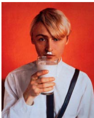
GENERAL IDEA Nazi Milk, 1979-1990 projection de laque sur vinyl, 225 x 160 cm