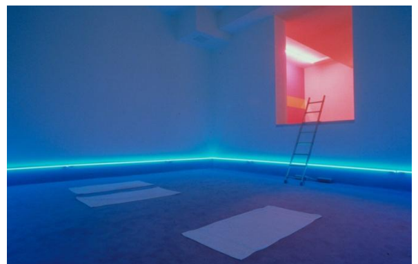
Dominique GONZALEZ-FOERSTER dans la Salle des Consuls Narbonne, Aude