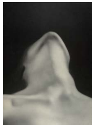
MAN RAY Anatomies , 1930 (tirage de 1970) épreuve noir et blanc tirée sur papier Guillemot 39,4 x 29,1 cm. © ADAGP Paris 2012