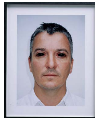
GRAHAM GUSSIN Know Nothing, Self-portrait as X-The man with X-Ray Eyes , 2003, impression numérique sur papier photo, 52 x 42 cm. © G. Gussin