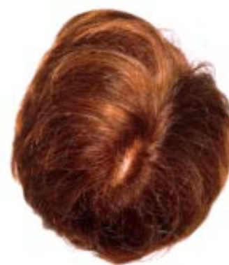
PATRICK TOSANI XX , 1992 tirage cibachrome 193 x 169 cm. © ADAGP Paris 2012