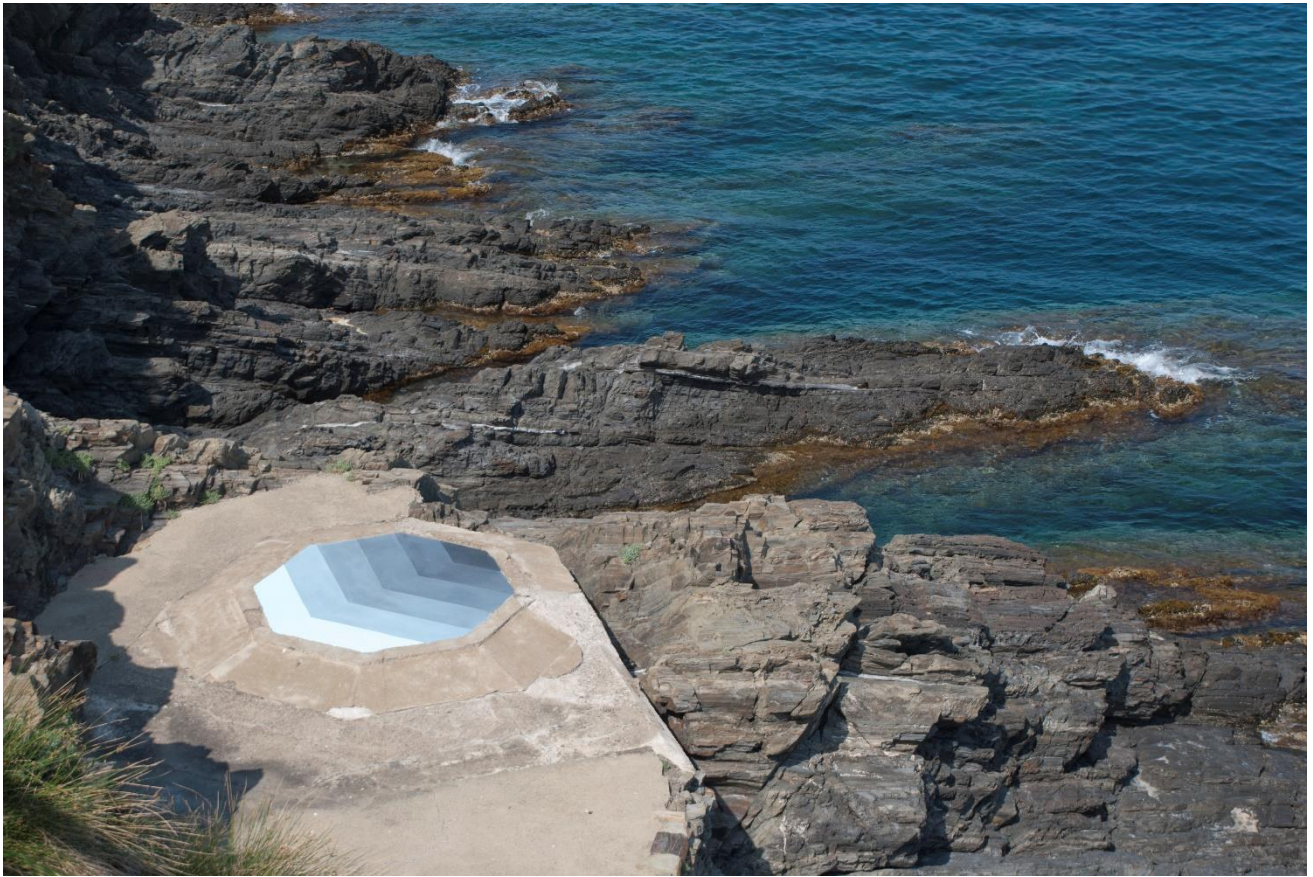
L'oeil du maelström , peinture à l'acrylique sur sol - Intervention dans l'espace public, pour la Manifestation d'Art Public # 6 Cerbère, France 2017 - Crédit photo : Rébecca Konforti