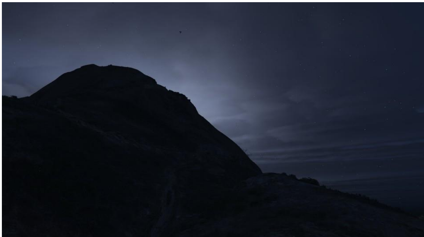
Moonlight at Mount Gordo, 2018, James Joffrin & Baptiste Roca

Ma pratique consiste dans un premier temps à regrouper des souvenirs, des entités, des témoins visuels de ma génération et des environnements - a priori sans valeur extrinsèque - qui me procurent des émotions, pour ensuite créer des connections ou des dialogues, de façon à retranscrire un langage iconographique qui deviendra soit un jeu, une sortie, une lecture légère mais peut-être aussi une simple banalité pour le spectateur.