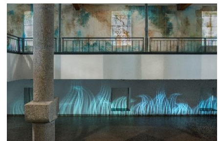
Vue de l'exposition Courant Continu à Agde - Collection Frac OM - 2018.