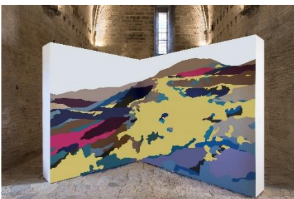
Pablo Garcia - Exposition Extensions de Graffitis , collection des FRAC, Fort Saint-André, Villeneuve Lez Avignon, 2018 - Collection Frac OM – Photo P. Schwartz.

Découvrez les Collections des FRAC en ligne : lescollectionsdesfrac.org · Projet Videomuseum