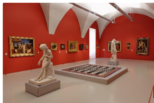
Exposition Le rêve de la fileuse - Musée Fabre Montpellier - 2018