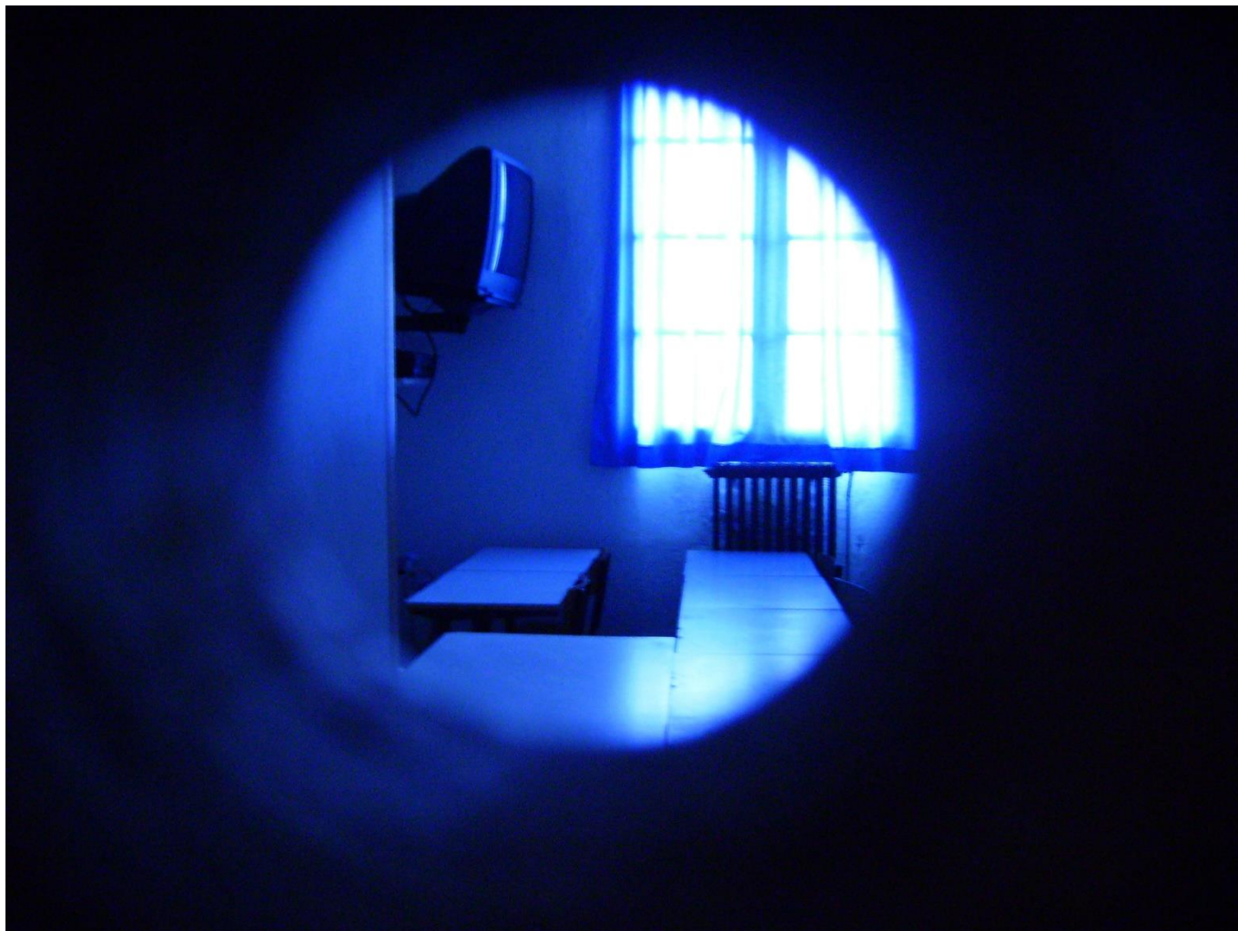
James Joffrin, Salle 40 , 2008