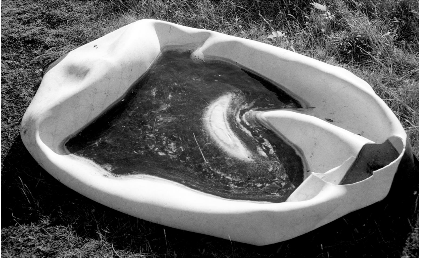
Série Sans-titre (2012) Sans titre n°16 - Tirage argentique sur papier satiné, 73x54 cm

« Tu me demandes d'écrire sur ton art qu'est-ce que je peux dire de ton art ?