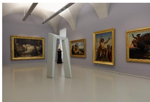
Exposition Le rêve de la fileuse - Musée Fabre Montpellier - 2018

Placé sous le signe de la rencontre, le visiteur est invité à découvrir un dialogue poétique entre trois collections : celle du musée, celle du FRAC et celle de la chorégraphe A catalogue of steps .