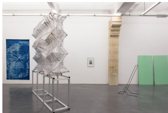
L'impossible mordant physique - Post_Production, 2017

Post_Production consiste à accompagner quatre jeunes diplômé(e)s titulaires du DNSEP sorti.e.s de ces établissements, dans le cadre d'un parcours en lien avec le milieu professionnel de l'art comprenant une période de production plastique et un temps d'exposition. Cet accompagnement consiste en un échange critique et une proposition d'exposition collective.