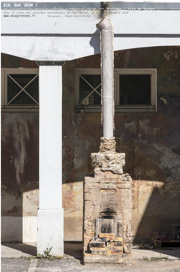
Extension d'un four – Sculpture - Ensemble de 4 sculptures, terre papier - 2 pièces dimensions : 220 x 25 cm - 1 pièce dimensions : 150 x 25 cm - 1 pièce dimensions : 120 x 25 cm