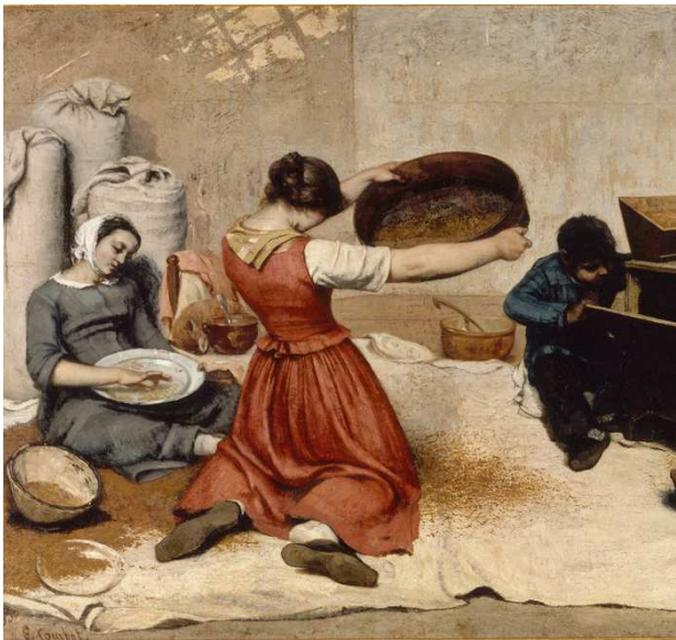
Gustave Courbet, Les cribleuses de blé , 1854

Le thème de la femme au travail est traité depuis longtemps par les peintres. Une tradition née à la Renaissance dans les Flandres, avec Brueghel, que l'on peut suivre chez les frères Le Nain, puis au XIXe siècle avec Millet, Courbet et Bastien-Lepage, cultive une vision réaliste du travail paysan et n'hésite pas à montrer les difformités du corps de la femme. On peut d'ailleurs supposer que c'est la dureté du travail qui aboutit à la déformation des corps. Cette tendance réaliste cohabite avec une vision plus idéalisée du corps, dans des mises en scènes plus artificielles.