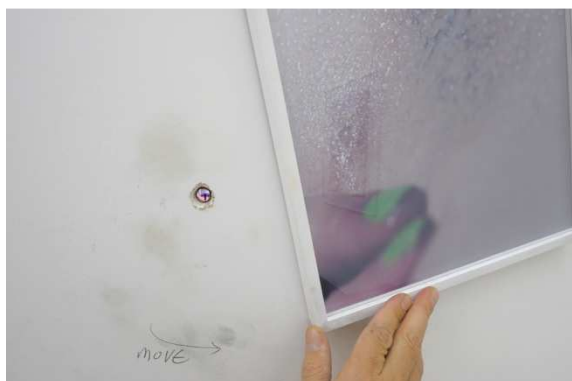
FRIED SWEAT, 2008

Installation vidéo, 2' – en boucle, dimensions de la boîte recouverte de miroirs : 93,5 x 25,5 x 42 cm