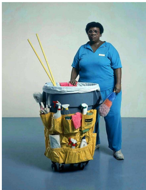
Duane Hanson, Queenie , 1988, bronze polychrome

Duane Hanson prend des instantanés de la vie américaine et les reproduit en volume avec un souci de précision hyperréaliste. Il crée des types sociaux, des personnages oscillant entre une généralité anonyme et une individualisation méticuleuse. C'est en général une vision désabusée des valeurs de la société américaine qui domine, entre ennui et somnolence.