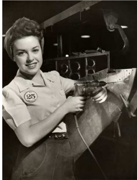
George Marks, Woman on an aircraft assembly line

Les deux guerres mondiales sont l'occasion de montrer la femme à l'usine, mais pour insister sur son caractère anormal, exceptionnel (ce qui est historiquement faux). Certaines images, à l'évidence mises en scène sans grand souci de vraisemblance, montrent une femme idéalisée, dont la mise détonne complètement dans l'environnement de la chaîne de montage. Ces photographies sont quasiment des collages incluant la vie hors du travail dans un environnement professionnel.