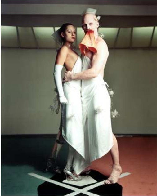
Matthew Barney, The cremaster cycle (1994-2002)

Matthew Barney, venu à l'art après une carrière de sportif de haut niveau et de mannequin, travaille sur les contraintes imposées au corps. Son expérience professionnelle l'a rendu sensible aux notions d'effort, d'accomplissement physique et de performance. Son œuvre travaille aussi les notions de beauté et de monstruosité en interrogeant les normes esthétiques qui régissent notre regard, et notre action, sur le corps. Dans le long cycle de films Cremaster , il met en scène son propre corps, ou celui d'Ursula Andress, en les soumettant à des contraintes qui les transforment en quelque chose d'à la fois fascinant et répugnant.