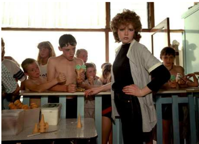
Martin Parr, New brighton, caissière

Martin Parr photographie les vacances de la middle-class britannique dans les années '80, insistant sur la promiscuité, la moiteur des corps, les excès alimentaires. Ce cliché met en scène la caissière d'un magasin de glaces. La jeune vendeuse paraît très contrainte, normée, dans un environnement où domine le laisser-aller des vacances. Derrière le regard qui nous fixe, on sent cependant la lassitude, le refus de cette condition et l'envie d'autre chose.