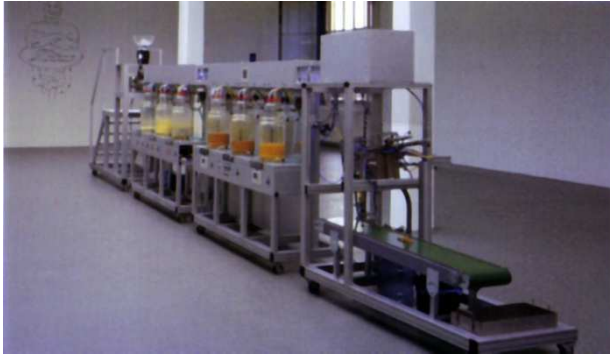
Wim Delvoye, Cloaca , 2000, version du Migros museum Zurich

L'artiste belge Wim Delvoye utilise les acquis de la biologie et de la génétique pour réaliser Cloaca , une installation biotechnologique reproduisant le cycle complet de la digestion des aliments depuis l'ingestion et la mastication jusqu'à la défécation. Cloaca se compose de 6 cloches de verre reliées entre elles par des tubes, des tuyaux et des pompes. Les aliments circulent pendant 27 heures dans ce circuit digestif artificiel, géré par ordinateur, contenant des enzymes et des bactéries. L'installation est maintenue à la température du corps humain. Cloaca est un véritable projet scientifique dont la particularité est d'être conçu et dirigé par un artiste en collaboration avec des chercheurs et des ingénieurs. Delvoye crée une saisissante vanité contemporaine qui réduit l'homme à un dispositif de production industriel. L'homme ici s'efface devant la machine. On est vraiment peu de choses.