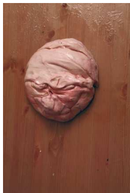
Ci-dessus : MARY'S CHERRIES , 2004 Installation vidéo, 5'50'' – en boucle, dimensions variables Collection Frac Languedoc-Roussillon