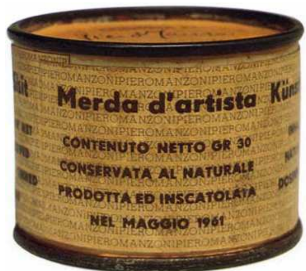
Piero Manzoni, Merde d'artiste , 1961.

Quand il crée Merde d'artiste en 1961, Piero Manzoni essaie de répondre à une certaine critique de l'art contemporain, rejetant le parti pris de non-expressivité des œuvres et leur caractère conceptuel. Le critique, forcé d'admettre que la merde d'artiste montre un aspect très intime de l'artiste, souhaitera ne pas la visualiser, préférant qu'elle reste pour lui un pur concept, dans sa boîte. Auteur d'une œuvre-piège à l'évidence transgressive et jubilatoire, Manzoni est un des premiers à proposer à la vente (au prix de l'or) quelque chose directement issu de son corps. Quelques années plus tard, Michel Journiac proposera son sang transformé en boudin, dans Messe pour un corps .