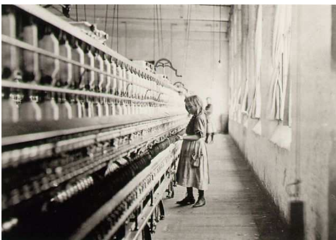
Lewis Hine, Girl worker in a Carolina cotton mill , 2008

Le thème de la femme au travail est traité depuis longtemps par les peintres. Une tradition née à la Renaissance dans les Flandres, avec Brueghel, que l'on peut suivre chez les frères Le Nain, puis au XIXe siècle avec Millet, Courbet et Bastien-Lepage, cultive une vision réaliste du travail paysan et n'hésite pas à montrer les difformités du corps de la femme. On peut d'ailleurs supposer que c'est la dureté du travail qui aboutit à la déformation des corps. Cette tendance réaliste cohabite avec une vision plus idéalisée du corps, dans des mises en scènes plus artificielles.