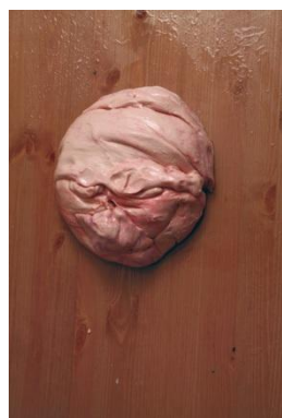
Ci-dessus : MARY'S CHERRIES , 2004 Installation vidéo, 5'50'' - en boucle, dimensions variables Collection Frac Languedoc-Roussillon