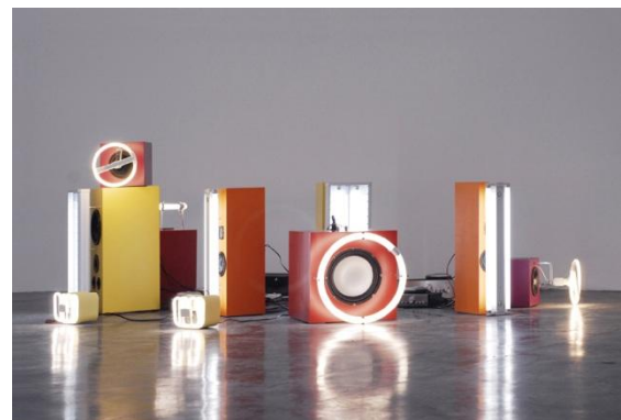
Patrice CARRÉ Sons , 2002 Collection Frac Languedoc-Roussillon

Vernissage vendredi 27 juillet 2012 à 19h Contact : 04 67 57 63 91 contact@ville-aniane.com