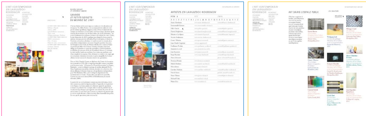
Simulation des pages du portail.

UN PORTAIL UNIQUE DÉDIÉ À L'ART CONTEMPORAIN EN RÉGION LANGUEDOC-ROUSSILLON