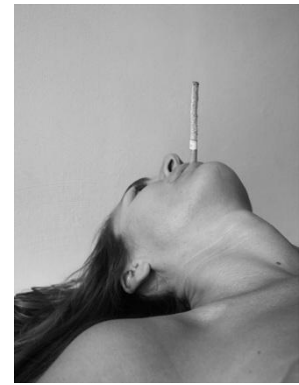
Fiorenza MENINI Empire , 2011 Collection Frac Languedoc-Roussillon

Vernissage jeudi 6 septembre 2012 à 18h30 Contact : 04 66 76 35 70 - info@carreartmusee.com