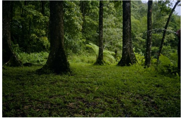
Erwin WURM Outdoor Sculpture , 2004 © Adagp, Paris, 2012 Collection Frac Languedoc-Roussillon

Vernissage samedi 9 juin 2012 à 18h30 Contact : 04 66 47 63 76 vallon@levillaret.fr