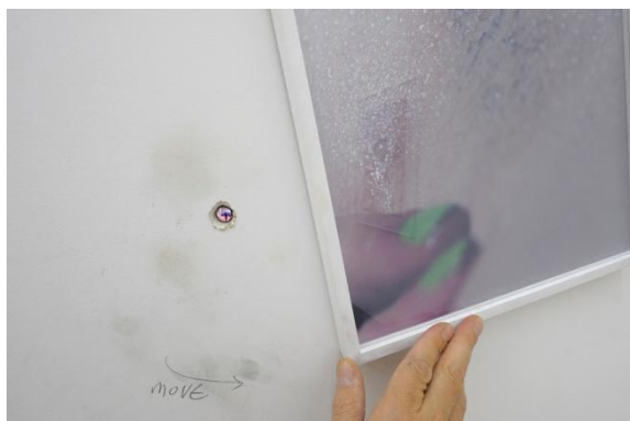
FRIED SWEAT, 2008

Installation vidéo, 2' - en boucle, dimensions de la boîte recouverte de miroirs : 93,5 x 25,5 x 42 cm © Charles Duprat