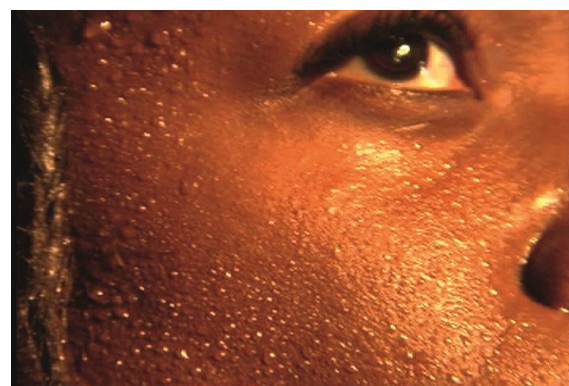
TROPICAL BREEZE, 2004

Installation vidéo, 3'45'', dimensions variables