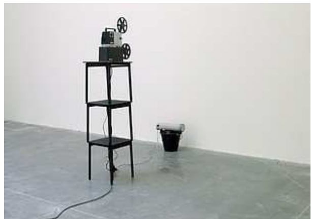
Sylvia Bossu, La mangeuse d'image , 1992, Coll Frac LR