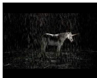
Maïder Fortuné, Licorne , 2007, vidéo, 7min., son Xavier Klaine