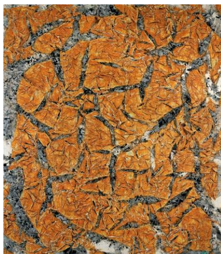
Simon Hantaï, le manteau de la vierge, 1962