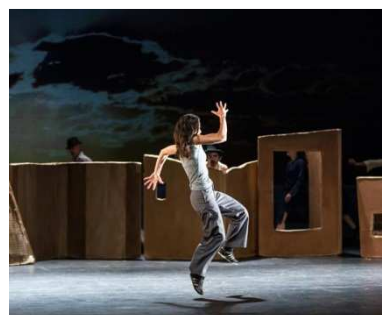
© Compagnie les gens du quai