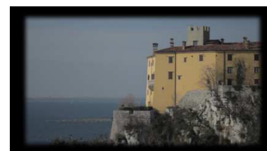
Maïder Fortuné, LEJ #1 , 2013, vidéo, 1h07min., ruban de texte imprimé, plexiglas