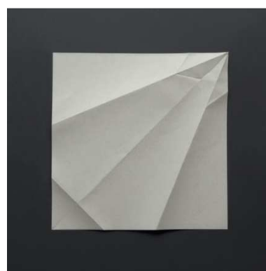
Maïder Fortuné, Figures défaites (Origamis) , 2011, série de 14 tirages couleur jet d'encre sur papier baryté, 25 x 25 cm