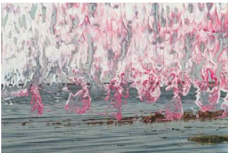
Gerhard Richter, photographie peinte 18 april05, 2005