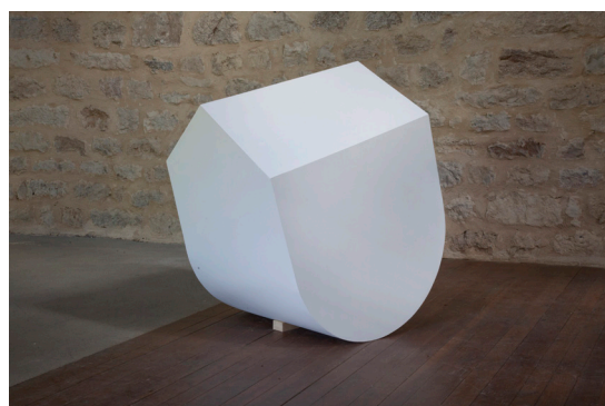
Suzy Lelièvre – Résidence 2017