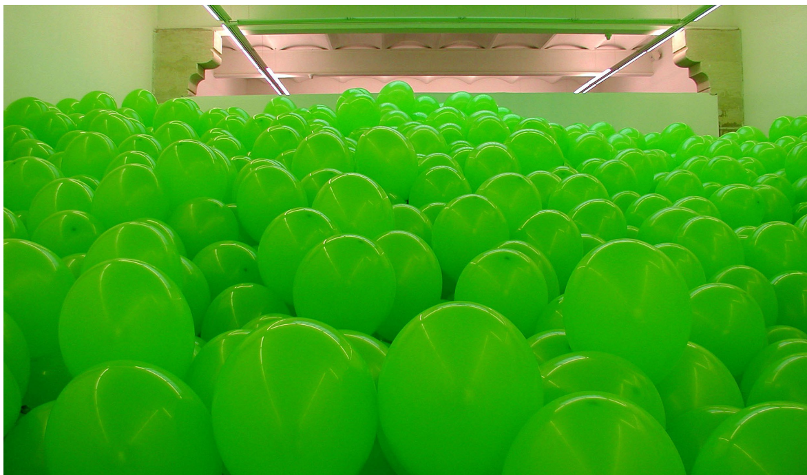
Vue de l'exposition, œuvre de Martin Creed, Work n°262 , 2001 Collection FRAC Languedoc-Roussillon.

« J'ai eu un déchaînement transcendantal de visions colorées aujourd'hui, dans le bus, en allant à Marseille. Nous roulions sur une longue avenue bordée d'arbres et je fermais les yeux dans le soleil couchant quand un flot irrésistible de dessins de couleurs surnaturelles d'une intense luminosité explosa derrière mes paupières, un kaléidoscope multidimensionnel tourbillonnant à travers l'espace. Je fus balayé hors du temps. Je me trouvais dans un monde infini... La vision cessa brusquement quand nous quittâmes les arbres. » (extrait du journal de B.Gysin, 21 décembre 1958).