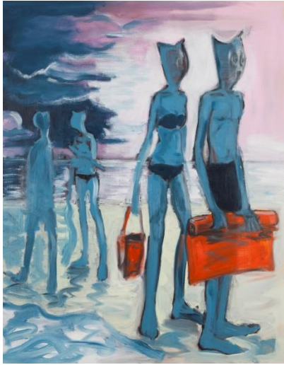
Alain Séchas, Natte orange , 2015, Huile sur toile, 146 x 114 cm. © Adagp, Paris 2016. Collection Frac LR.

Fondé en 1982, le Fonds régional d'art contemporain Languedoc-Roussillon est une collection publique de près de 1 300 œuvres réalisées par plus de 400 artistes. Elle s'enrichit annuellement grâce à de nouvelles acquisitions choisies par un comité composé de personnalités du monde l'art.