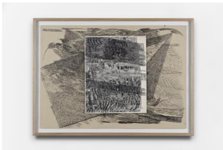
Julien Tiberi, Sans titre , 2015, encre sur papier, 70 x 100 cm. Collection Frac LR.

Découvrez le nouveau site des Collections des Frac, un projet porté par Videomuseum : www.lescollectionsdesfrac.org