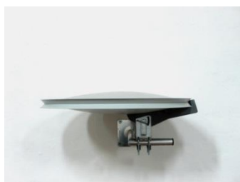
Hamid Maghraoui, Raid Sat 2009, 1 m x 90 x 40 cm, Photo Hamid Maghraoui, © Hamid Maghraoui, Courtesy de l'artiste

Les images en haute définition sont disponibles sur demande ou téléchargeables sur le serveur ftp du Frac via le lien suivant :