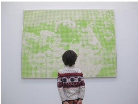
Photo prise par les enfants participant aux Ateliers du mercredi, séance sur la prise de vues et le cadrage.