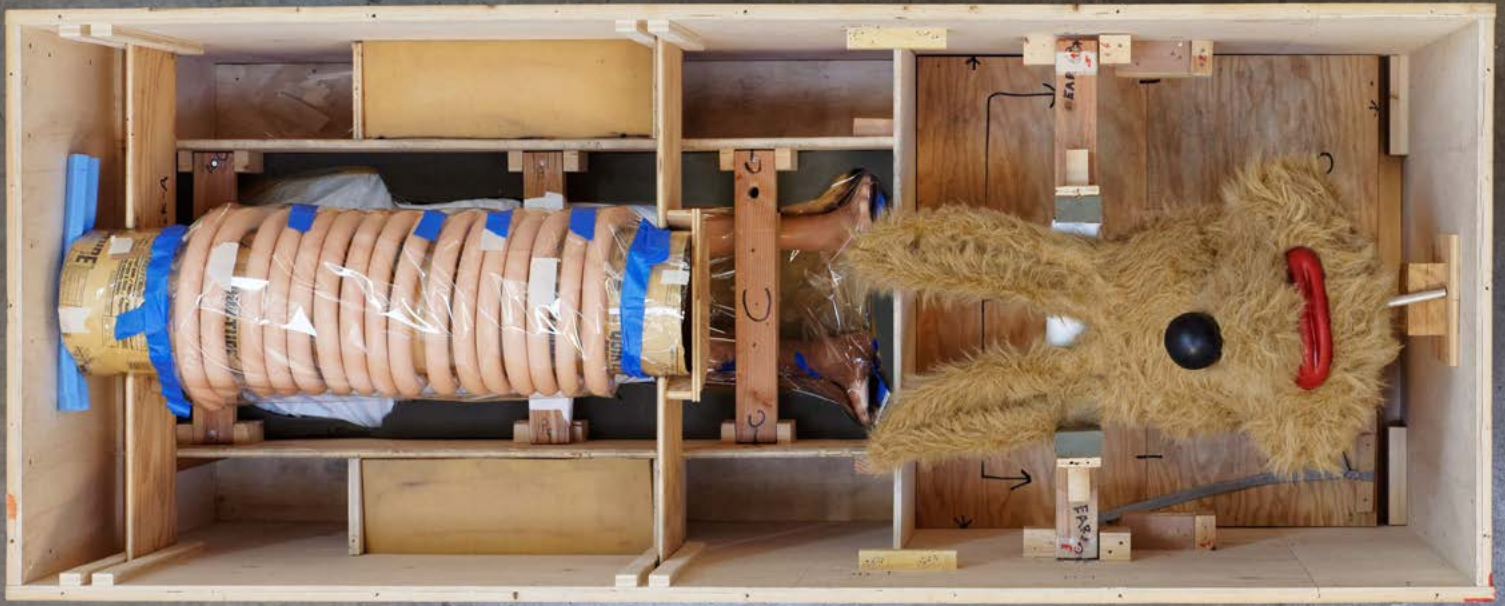
© Paul MCCARTHY, Spaghetti Man dans sa boîte, 1993. Collection Frac Occitanie Montpellier