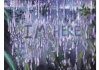
Visuel : Lana Duval, Soleils mouillés , 2020, production pour Horizons d'eaux #4 , parcours réalisé par les Abattoirs, Musée - Frac Occitanie Toulouse et le Frac Occitanie Montpellier © Lana Duval

Toulouse (Haute-Garonne) Cale de Radoub 21 juillet – 21 septembre 2020