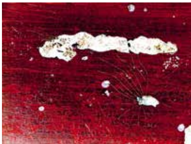
Visuel : Simone Villemeur-Deloume, Le parachute , 1984, Photographie couleur, 30,2 x 40,1 cm, Collection les Abattoirs, Musée - Frac Occitanie Toulouse © droits réservés - Crédit photographique : Grand Rond Production

15, Port La Fabrique, La Redorte Ouvert tous les jours en juillet et en août et lors des Journées du Patrimoine de 10h à 13h et de 14h à 18h30 Du 1 er septembre au 31 octobre sur rendez-vous Tel : 04 68 27 80 80 | www.laredorte.com | info@laredorte.com