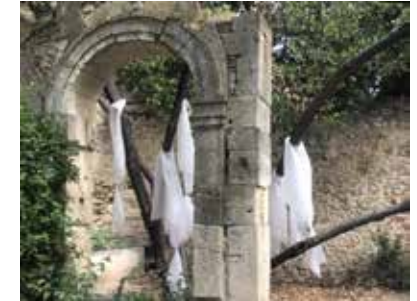
Visuel : Alba Sagols, Care drain , 2020, production pour Horizons d'eaux #4 , parcours réalisé par les Abattoirs, Musée - Frac Occitanie Toulouse et le Frac Occitanie Montpellier © Alba Sagols

Care drain , dont l'expression désigne les mouvements migratoires d'individus qui travaillent dans le soin, découle de la rencontre avec un arbre souffrant du parc d'Ayguesvives. Dans une démarche reliée à l'éthique de la sollicitude, cette installation fantomatique résulte d'une performance ritualisée de prise de soin d'un arbre touché par la foudre. Sa forme réfère aux pratiques païennes des arbres à loques, sur lesquels on accrochait les vêtements d'une personne malade dans l'espoir de sa guérison ou d'un soulagement, notamment pendant les épidémies de peste. Elle répond ainsi à des questionnements liés à notre rapport au vivant dans un contexte de crise sanitaire, écologique et sociale, où elle vient incarner une symbolique du care . Le film issu de cet événement, visible via QR Code, aborde de manière horizontale des points de vue sur différentes échelles du vivant présent dans l'environnement direct de l'arbre.