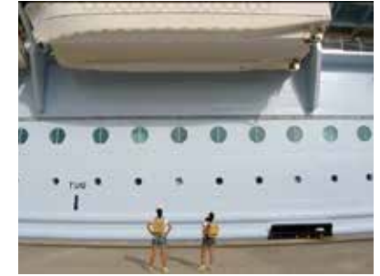
Visuel : Becquemin & Sagot, Bigger; Road-movie cruise - until the end of the world #forever , 2020, production pour Horizons d'eaux #4 , parcours réalisé par les Abattoirs, Musée - Frac Occitanie Toulouse et le Frac Occitanie Montpellier © Becquemin & Sagot

Œuvre issue de Road-movie cruise - until the end of the world #forever , installation (sculpture textile, bande son), 2020, courtesy H Gallery