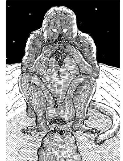
Jimmy Richer, Dessin extrait du roman graphique CASA, 2020 © Jimmy Richer

Jimmy Richer présente CASA, une paléo-fiction traduite sous la forme d'une fresque immense et augmentée d'une sélection d'œuvres de la collection du Frac Occitanie Montpellier, élaborée par l'artiste lui-même en écho à son exposition.